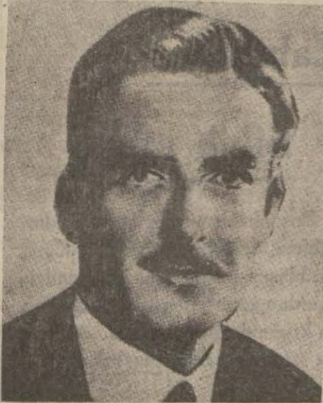
Hatay anlaşmasında büyük rolü geçen dost İngiliz dışişleri bakanı Eden

İngiliz hariciye nazırının iştirakiyle yapılan prensip anlaşmasında Edenin büyük rolü olmuştur. Bunun kat'i anlaşma takip etmiştir.