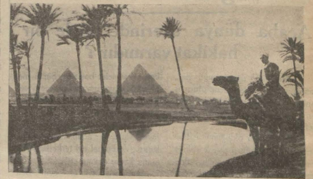
Mısır ehramlarından bir görünüş

Kapitülasyonların ilgası - Mısırdaki yeni ordu teskilâtı-Mısırdaki petrol menbaları